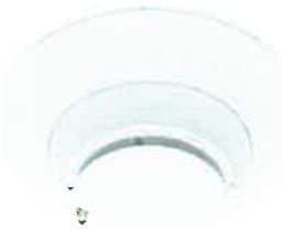
Fig. 2. Imagen referencial de detector de humo