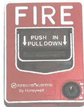
Fig. 3. Imagen referencial de la estación Manual