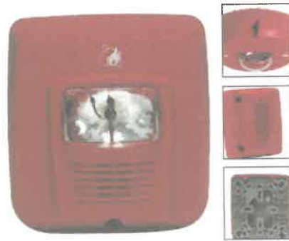
Fig. 4. Imagen referencial de la Sirena estroboscópica