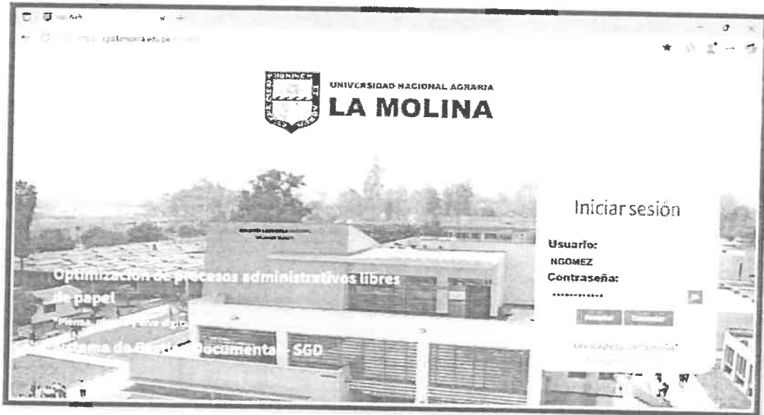
FIGURA N°01: SGD-UNALM