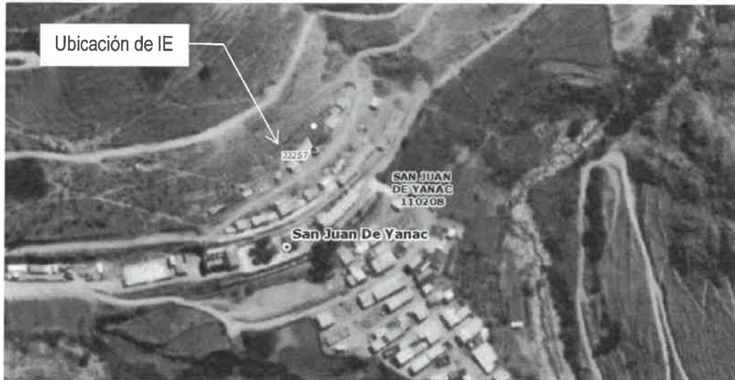
Imagen 02: Ubicación de la Institución Educativa 22257

La Institución Educativa cuenta con área destinada a educación con área de 1,592.59 m 2 , bajo administración interna reflejado en la resolución Directoral N°0563-2024.