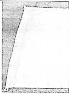
Orejas de Driza