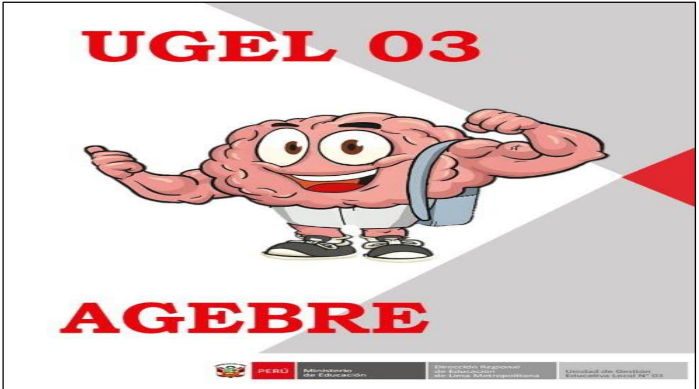
IMAGEN REFERENCIAL DE LA PORTADA