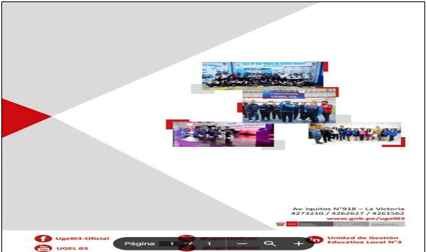
IMEGEN REFERENCIAL CONTRAPORTADA