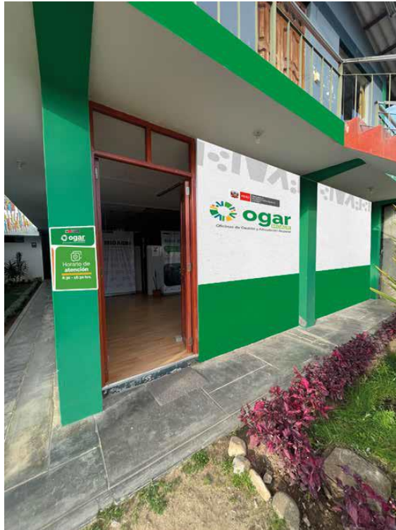
Vista de la Fachada principal