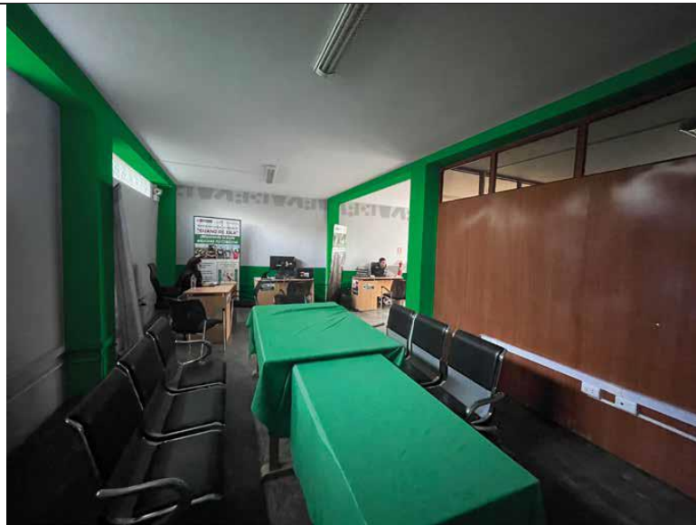
Vista de la Oficina 03

“Año de la recuperación y consolidación de la economía peruana”