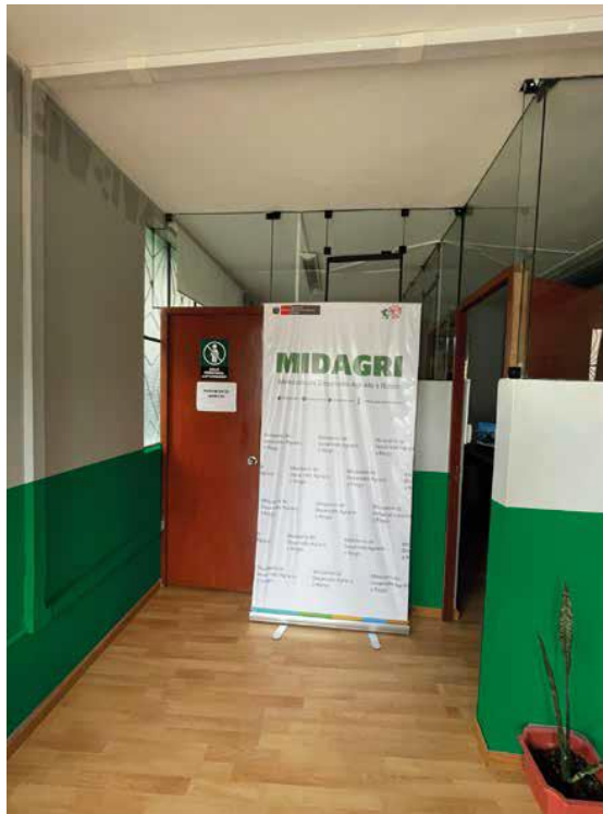
Vista de la pared exterior del Depósito

“Decenio de la Igualdad de oportunidades para mujeres y hombres” “Año de la recuperación y consolidación de la economía peruana”