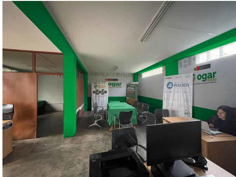
Vista de la Oficina 03

“Año de la recuperación y consolidación de la economía peruana”