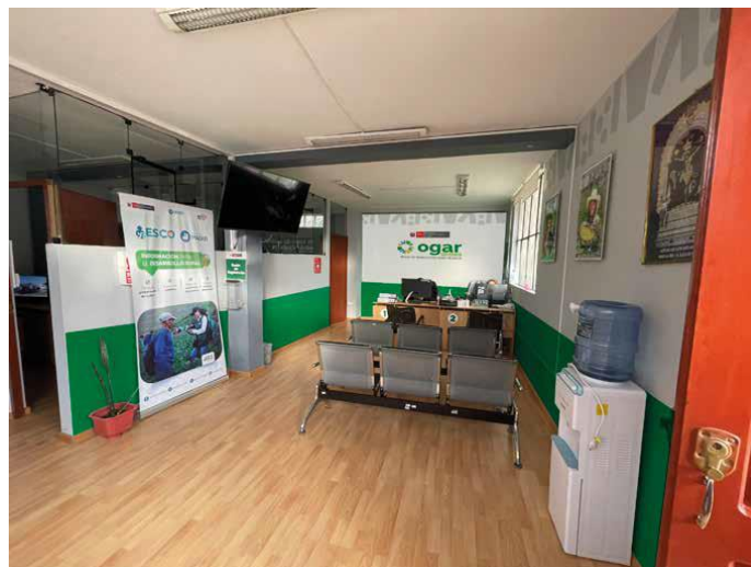
Vista de la Sala de Atención