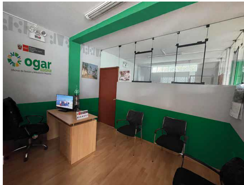
Vista de la Oficina del Coordinador