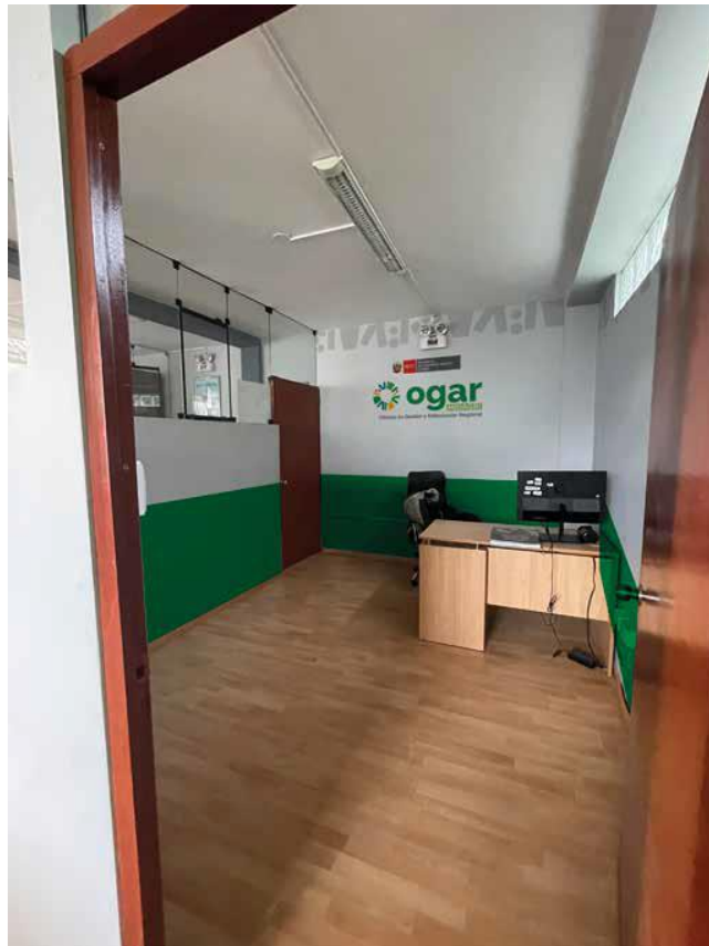
Vista de la Oficina 02

“Decenio de la Igualdad de oportunidades para mujeres y hombres” “Año de la recuperación y consolidación de la economía peruana”