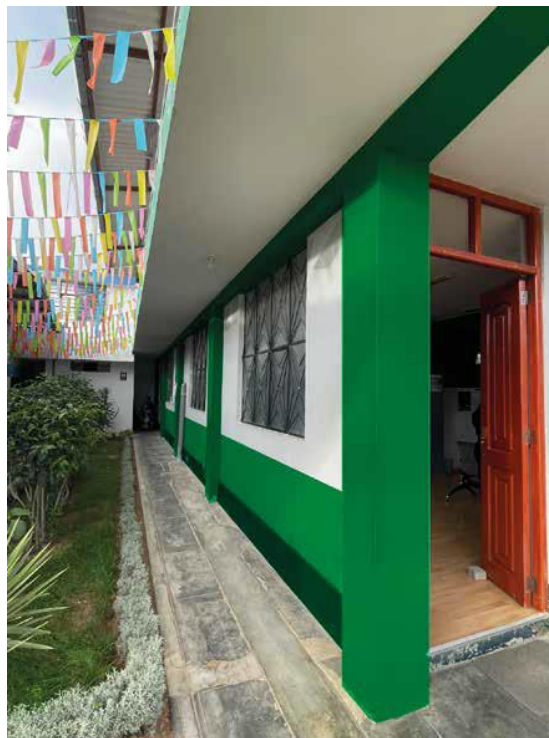
Vista de la fachada lateral