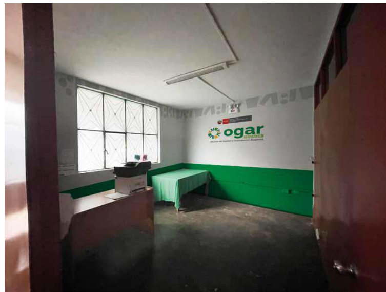
Vista de la Oficina 04