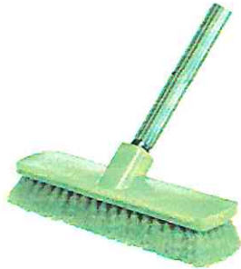
Escobillones cerda gruesa 20cm