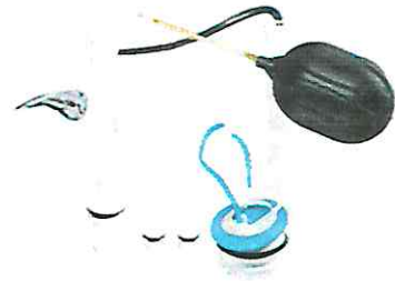
Accesorios para tanque inodoro