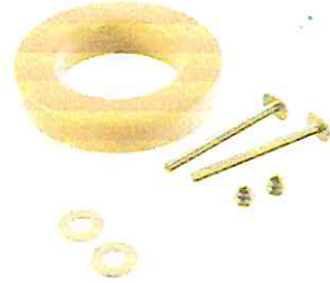
Cera para inodoro