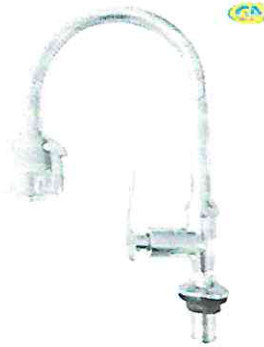
Llave para lavatorio tipo ganso