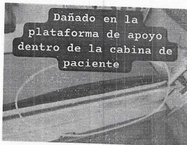
Dañado en la plataforma de apoyo dentro de la cabina de paciente