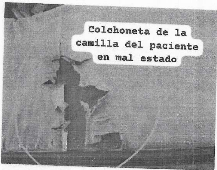
Colchoneta de la camilla del paciente en mal estado