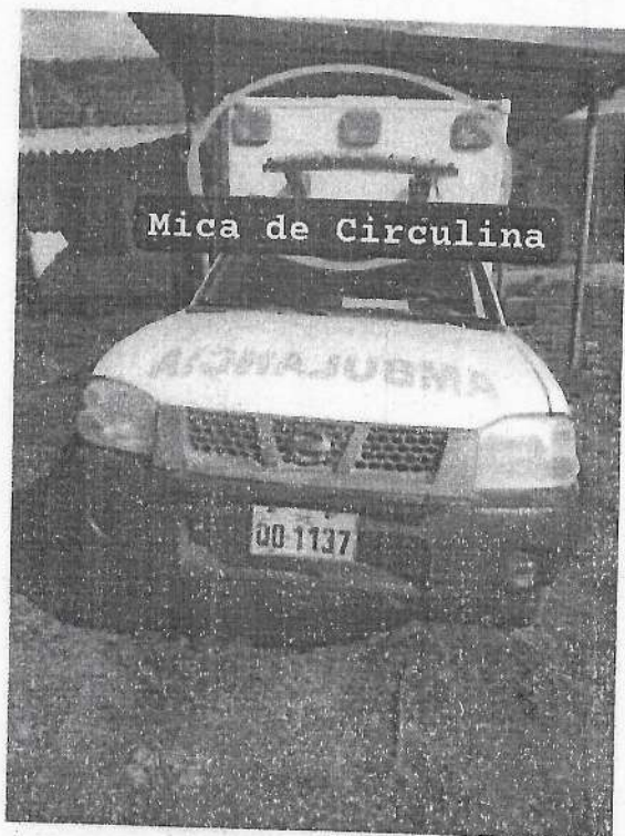
Mica de Circulina