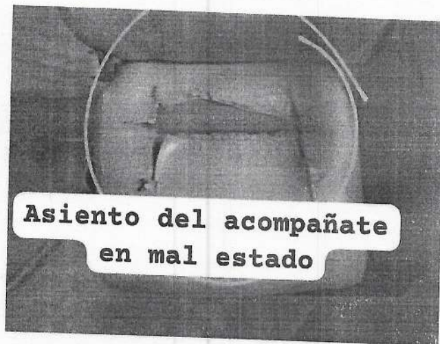
Asiento del acompañante en mal estado