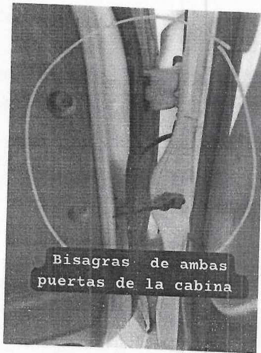
Bisagras de ambas puertas de la cabina

Es todo lo que puedo informar el estado de la ambulancia.