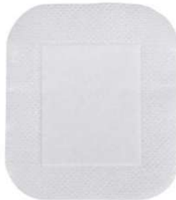
Fig.1: Apósito autoadhesivo (no incluye diseño)