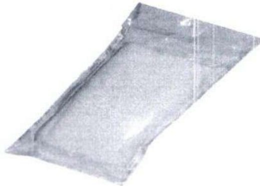
Fig.1: Apósito de gasa y algodón 10 cm x 20 cm (no incluye diseño)