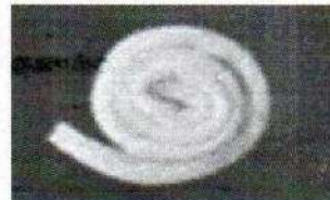
Fig.1: a) Apósito de alginato de calcio y b) mecha (no incluye diseño)