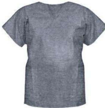
Fig.1: Chaqueta descartable (no incluye diseño)