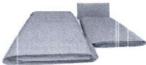
Fig.1: Papel crepado (no incluye diseño)