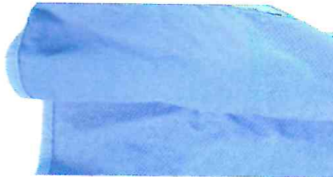
Detalle de forro con malla transpirable