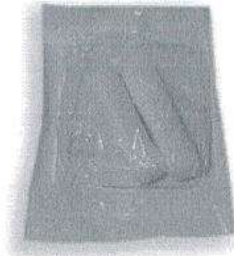
Fig.1: Mecha de gasa chica doblada (no incluye diseño)