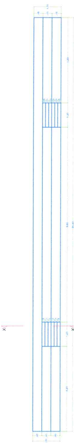
ELEVACION FRONTAL DE TRIBUNA ESC: 1/75