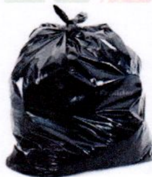
50 LT 2 micras