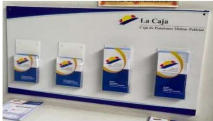
Distribución de porta dispensador de folletos