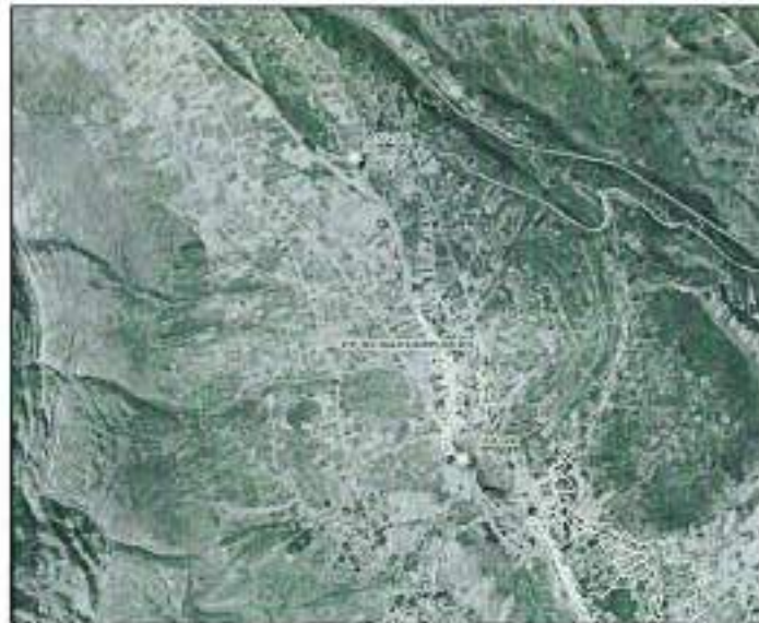
Figura 1. Ámbito de intervención

El lugar de la prestación del servicio se encuentra ubicado en el ámbito de las progresivas 157+500 a la 160+400 de los subtramos 3 y 4, ubicadas en el distrito de Ñahuimpuquio, provincia de Tayacaja, departamento de Huancavelica, según la siguiente descripción: