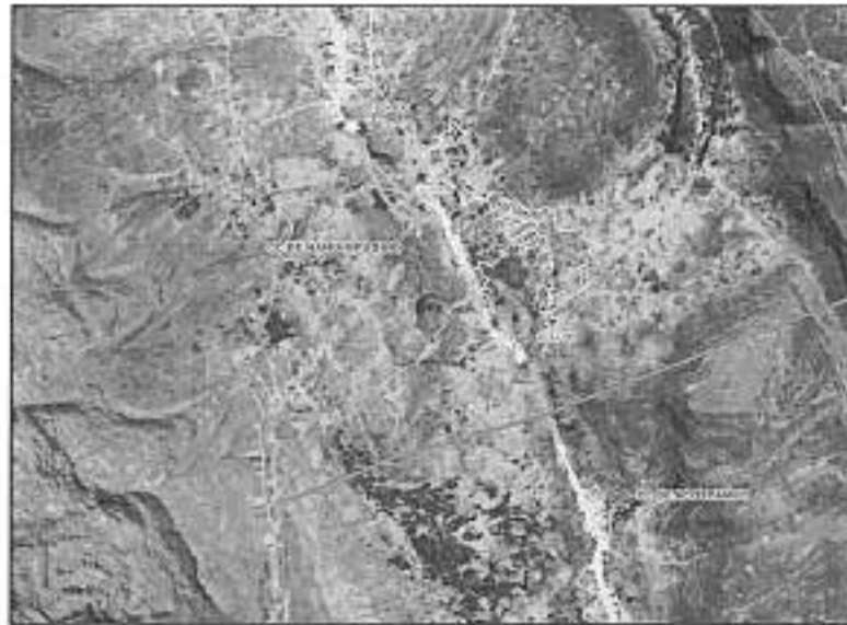
Figura 1. Ámbito de intervención

El lugar de la prestación del servicio se encuentra ubicado en el ámbito de las progresivas 160+400 a la 163+200, ubicadas en el distrito de Ñahuimpuquio, provincia de Tayacaja, departamento de Huancavelica, según la siguiente descripción: