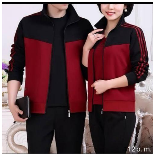
*Imagen referencial: Modelo 1