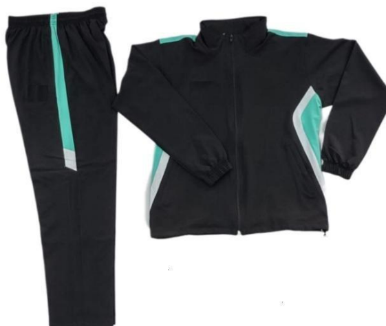
*Imagen referencial: Modelo 2