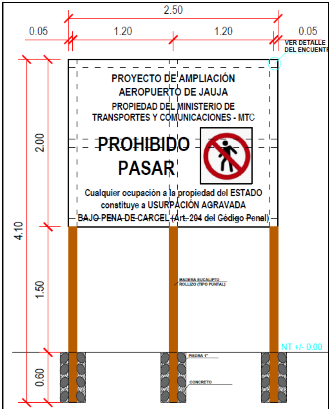
Imagen 3: Vista del letrero