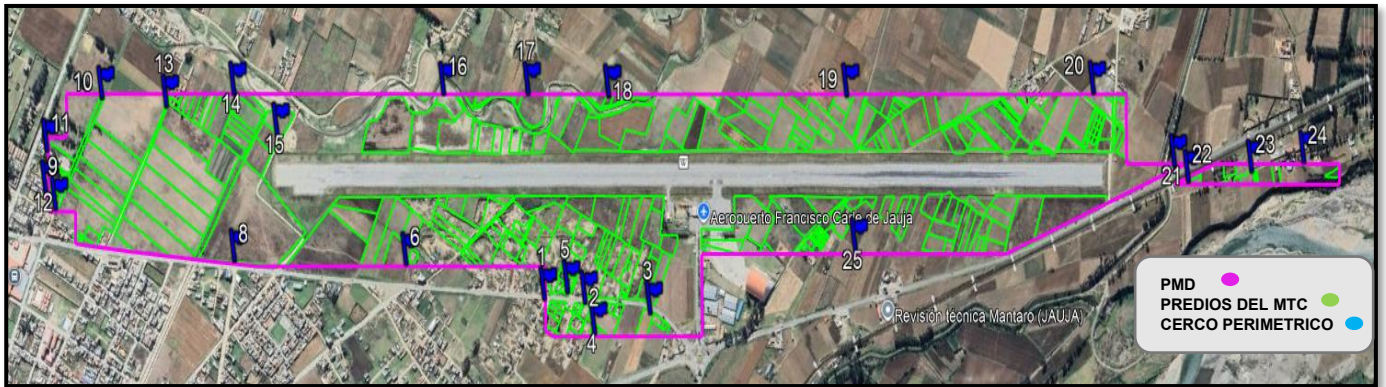
Imagen 1: Vista en planta de la ubicación de cercos perimétricos