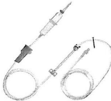
Fig. 1.: Línea para Bomba de Infusión sin Volutrol (No implica diseño)