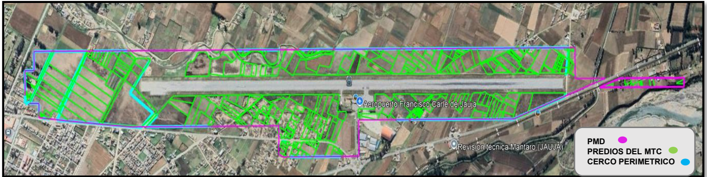
Imagen 1: Vista en planta de la ubicación de cercos perimétricos