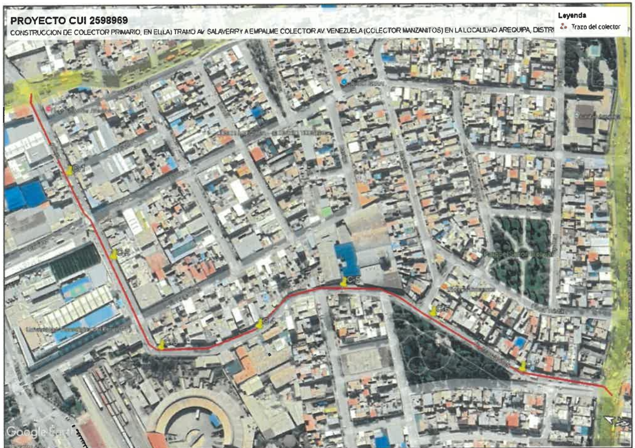
Ilustración 1: Ubicación preliminar de Calicatas