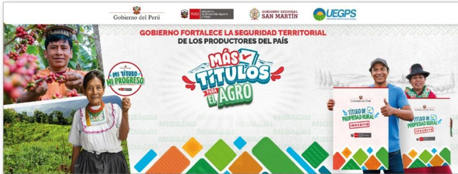
Imagen referencial de los dummies