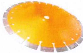
Disco D/Corte P/Cortadora Concreto