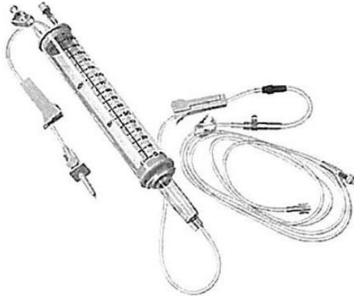
Fig. 1.: Línea para Bomba de Infusión con Volutrol (No implica diseño)