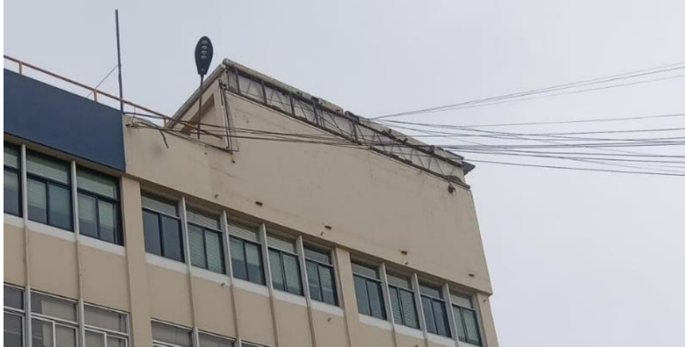
Imagen de la zona a resanar en la Fachada 2