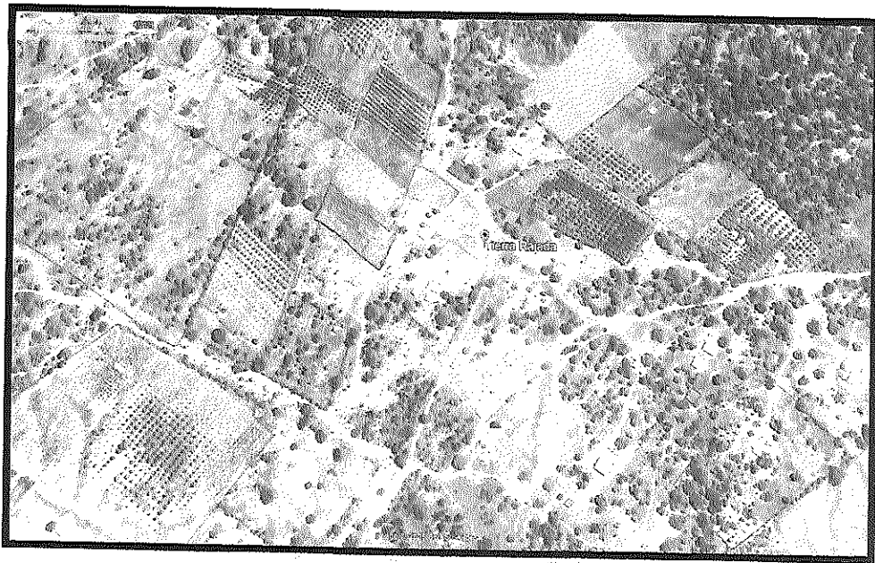
Ilustración 1. Imagen Satelital del área de influencia

Calle Santo Domingo N° 886 074 - 427108 mesãpartes@muniolmos.gob.pe www.muniolmos.gob.pe R.U.C. N° 20175975315