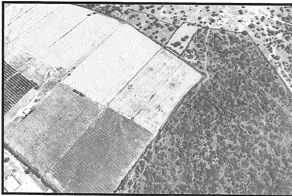
Ilustración 1. Imagen Satelital del área de influencia