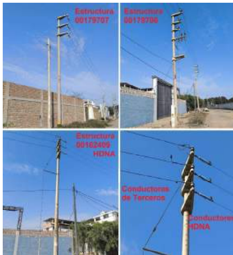
Figura 04: Estructuras 00179707 y 00179706 de MT de Terceros y estructura 00162409 de MT de Hidrandina.

encuentran los conductores desconectados vano adelante (ver Figura 04).