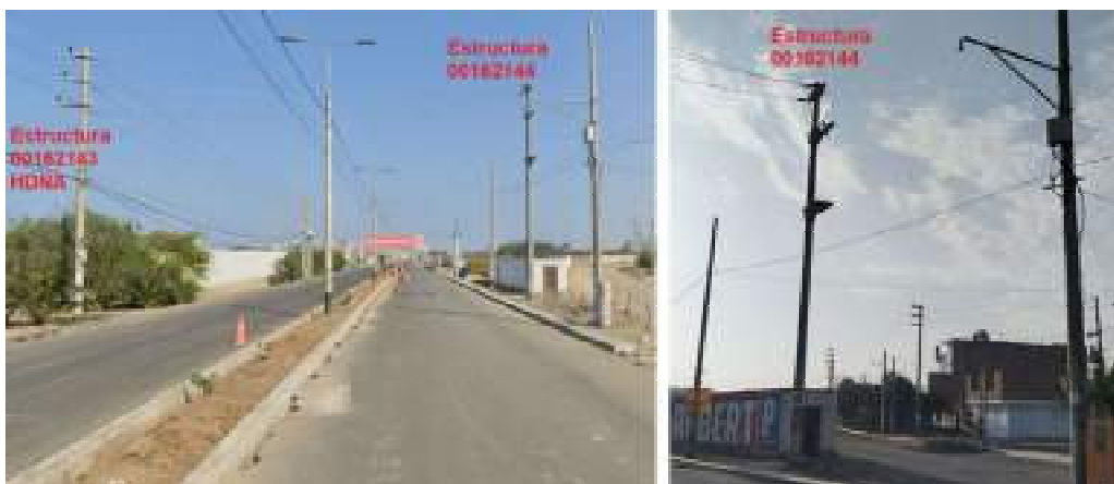
Figura 05: Estructuras 00162144 de MT de Terceros y estructura 00162143 de MT de Hidrandina.

El desmontaje de los conductores de un vano atrás en la estructura 00162144 se encuentran con energía eléctrica, en la Figura 03 se indican estos conductores de color celeste; en la estructura 00162143 se encuentran los conductores desconectados vano adelante (ver Figura 05).