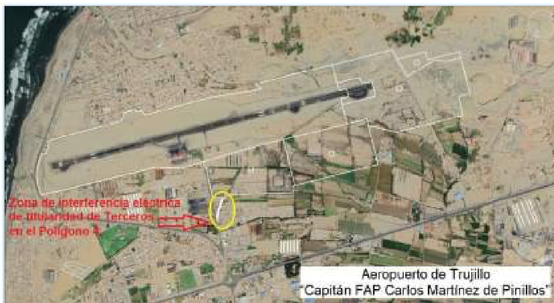
Figura 01: Ubicación de la interferencia eléctrica de Terceros en el PMD.