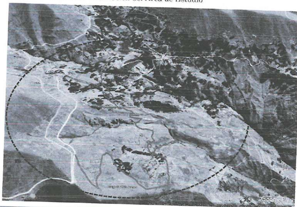
Gráfico N° 03: Micro Localización del Área de Estudio

UBICACIÓN DEL PROYECTO ESTA EN EL CENTRO POBLADO DE TUCO DEL DISTRITO DE ANCHONGA