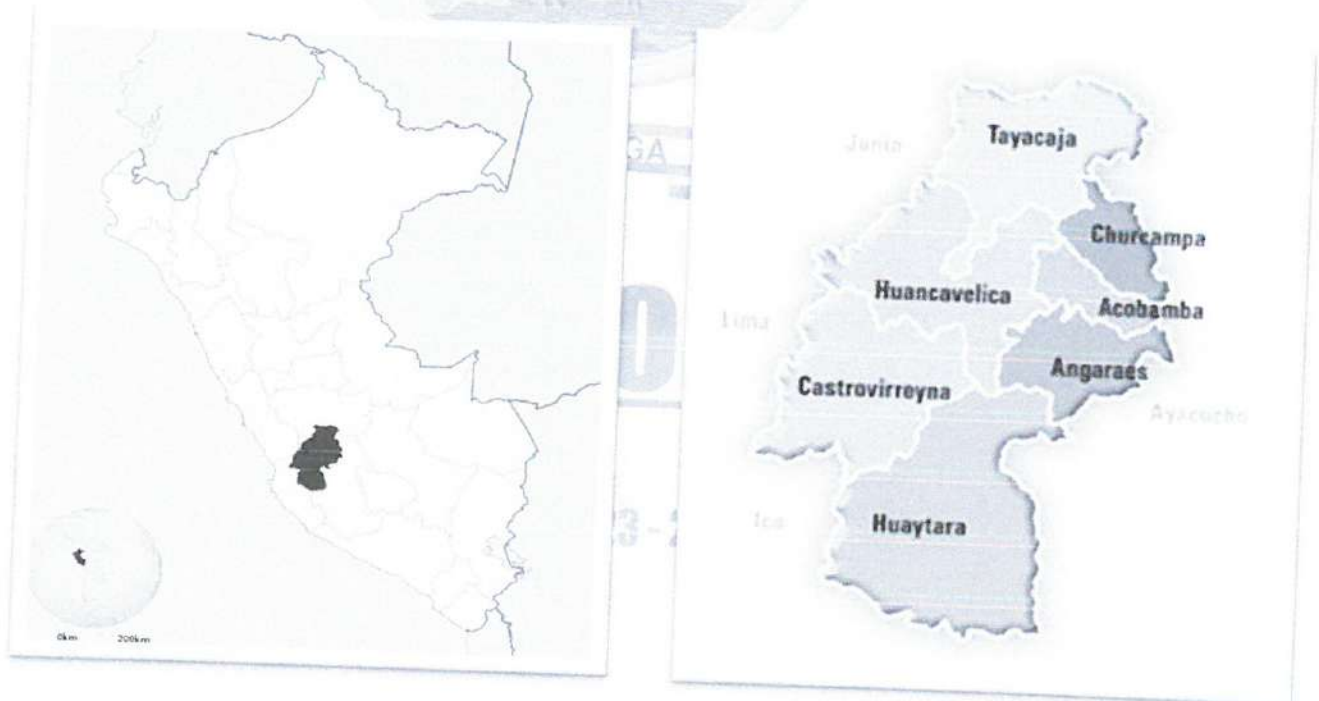
Gráfico N° 01: Macro Localización Nivel Nacional – Departamental