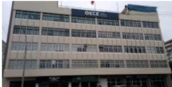
Imagen actual de la SEDE REGIDOR

De acuerdo con lo señalado en el objeto de contratación y actividades descritas, el contratista no se constituye como SUJETO OBLIGADO para presentar la Declaración Jurada de Interés, de acuerdo a lo señalado en los literales del artículo 3 de la Ley N° 31227.