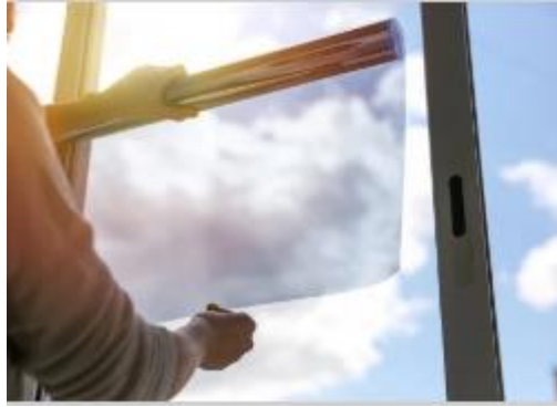
Imagen referencial del color del polarizado en vidrios para las dos sedes de OECE