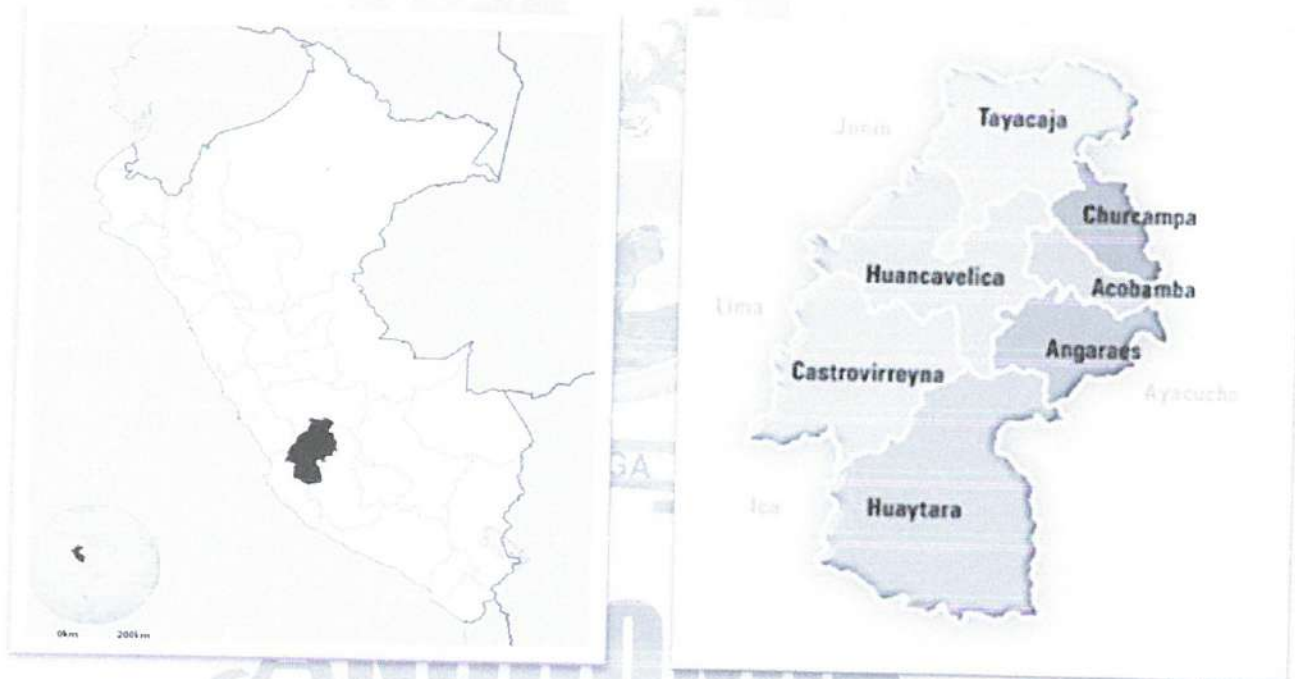
Gráfico N° 02: Macro Localización Nivel Provincial – Distrital