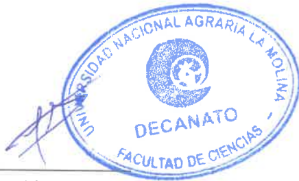
Firma del Solicitante