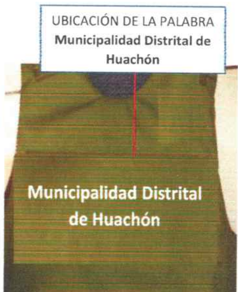
Imagen y color referencial