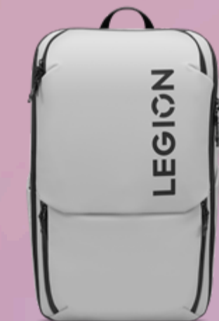
Lenovo Legion 17" Gaming Backpack GB800 (Light Gray) GX41U39300

Please click here to view the full list of accessories.