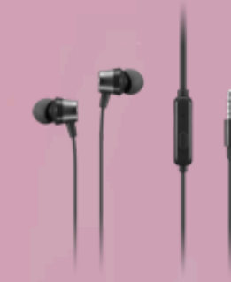
Lenovo Analog In-Ear Headphones Gen II Bulk Package (20pcs) 4XD1T54899