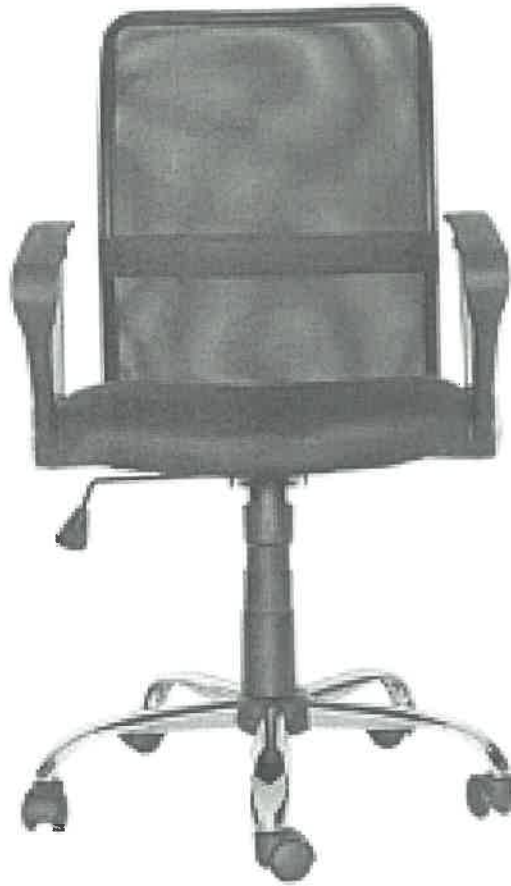
Imagen de sillón giratorio de metal