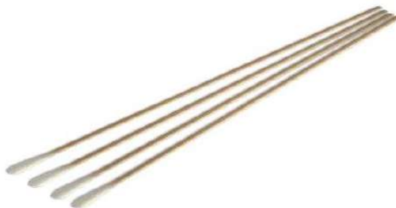
Fig. 1: Aplicador de madera con punta de algodón (No incluye diseño, imagen referencial)