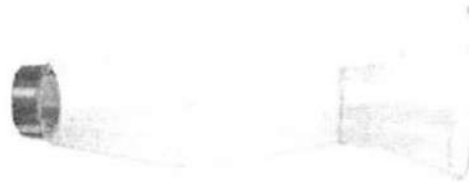
Fig 1.: Aerocámara espaciador – pediátrico (no incluye diseño)