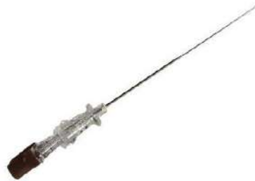
Fig.1: Aguja de anestesia espinal (no incluye diseño)