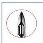
Fig. 2: Aguja punta lápiz (no incluye diseño)