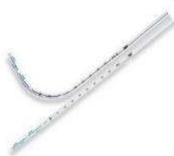
Fig.1: Catéter torácico (no incluye diseño)