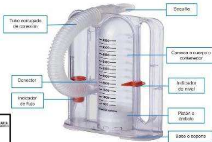
Fig. 1: Espirómetro de incentivo descartable (no incluye diseño)

IETSI - ESSALUD DIRECCIÓN DE EVALUACIÓN DE TECNOLOGÍAS SANITARIAS DIRECCIÓN DE INNOVACIÓN DE SERVICIOS Y EQUIPOS MÉDICOS 05 AGO 2025 FECHA DE ENTRADA EN VIGENCIA