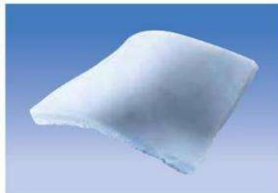
Fig.1: Esponja hemostática de colágeno (no incluye diseño)