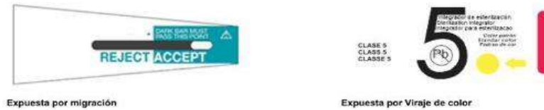
Fig.1: Integrador químico de vapor tipo V (No incluye diseño)