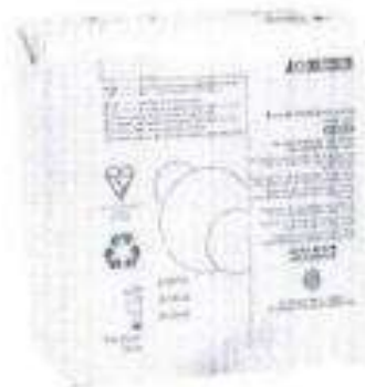
Fig. 1: Indicador químico tipo II Test de Bowie & Dick (no incluye diseño)