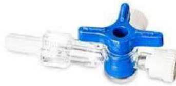
Fig. 1: Llave triple vía (imagen referencial, no incluye el diseño)