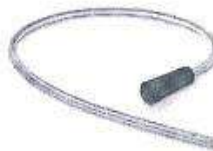
Fig.1: Sonda Nelaton (no incluye diseño)