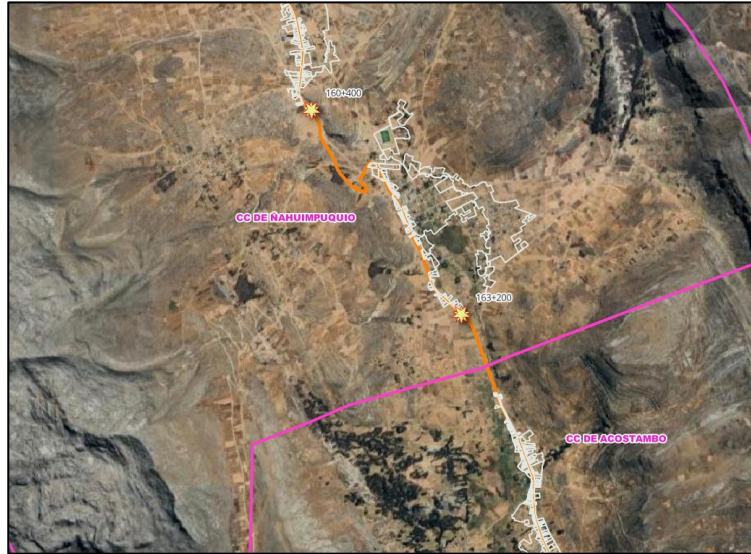
Figura 1. Ámbito de intervención