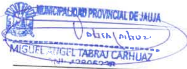
Firma del Solicitante