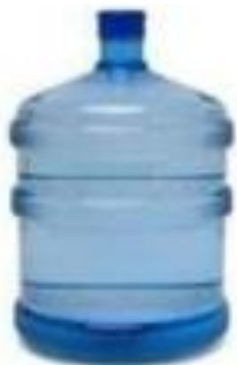
IMAGEN REFERENCIAL DEL BIDÓN