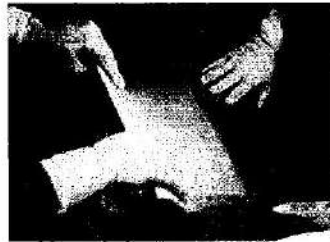
Fig.1: Campo quirúrgico autoadhesivo (no incluye diseño)