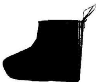
Fig.1: Botas descartables (no incluye diseño)